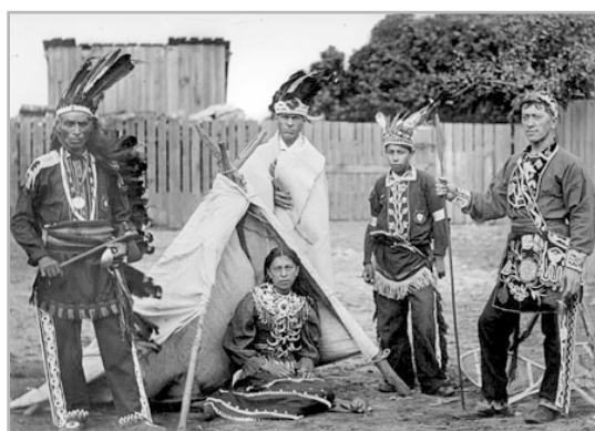
Danse indienne, Gabriel Veyre, 1898

Si vous désirez obtenir de plus amples renseignements sur la filmographie, visitez le site web de Grafics, http://cri.histart.umontreal.ca/grafics/ , ou contactez Pierre Véronneau, par courriel à : veronnp@sympatico.ca .