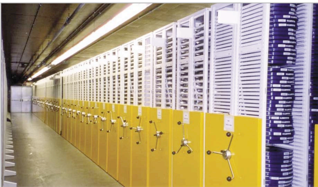
Bibliothèque et Archives Canada, Gatineau QC Photo une gracieuseté de René Villeneuve, Villeneuve Media Technologies

Finalement, l'industrie de l'archivage et de la préservation doit mettre le matériel audiovisuel sur le même pied que les biens imprimés. « Nous devons cesser de traiter notre matériel audiovisuel comme des citoyens de seconde classe dans nos fonds d'archives », dit Moosberger.